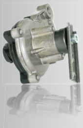
GNOM DP, GNOM DP CAN